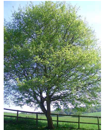
Erable champêtre Acer campestre

Côté municipalité : le C.A.U.E repéré un terrain communal qui pourrait accueillir la plantation de quelques fruitiers. Nous avons inscrit dans nos ambitions le projet de planter en novembre 2023 car, « à la Sainte Catherine, tout prend racine » !