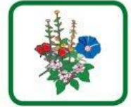
plantes, végétaux flétris