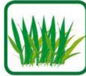
tontes de gazon