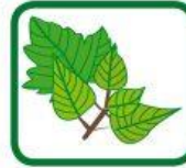
feuilles, taille de végétaux